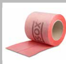
iSOX zelfklevende afdichtingsband