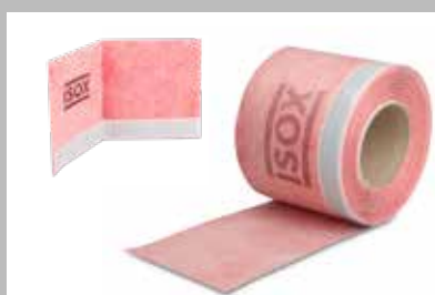
iSOX waterdichte afdichtingsband douchebak en iSOX waterdichte binnenhoek douchebak