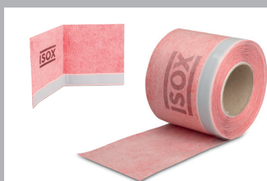
Bande d'étanchéité pour bac de douche ISOX et bande d'étanchéité angle intérieur pour bac de douche ISOX