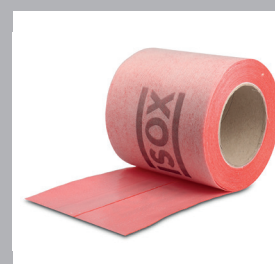
Bande d'étanchéité autoadhésive ISOX